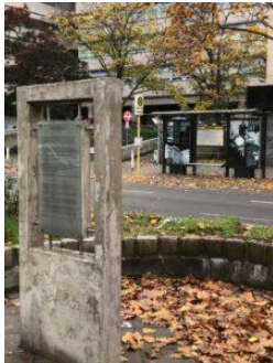
Rückseite der Gradiva Stele mit Blick zur als Gedenkort gestalteten Bushaltestelle

Die Gradiva steht dem Ort gegenüber, an dem das ‚Haus des Jüdischen Brüdervereins für gegenseitige Unterstützung‘ einst gestanden hat. Der internationale Kongress, der hier 1922 stattfand, war für die Psychoanalyse von großer Bedeutung, da er ein breites Spektrum richtungweisender psychoanalytischer Themen auffächerte.