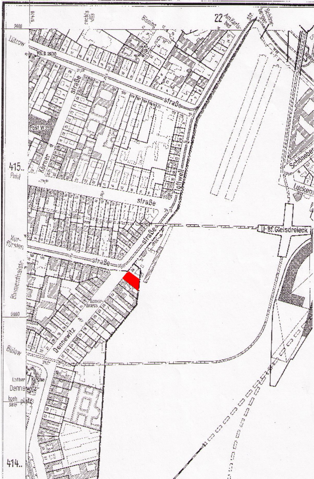
Plan aus den 1950er Jahren überlagert mit Google-Luftbild

Ein Gedenk-Spaziergang über die Kurfürstenstraße