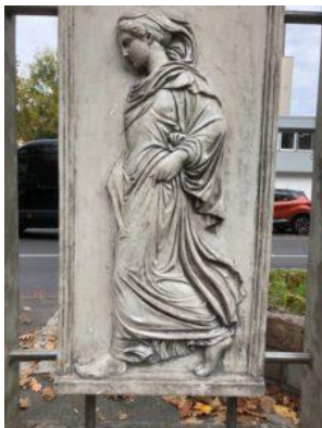
Gradiva-Stele auf dem Mittelstreifen der Kurfürstenstraße

In der Kurfürstenstraße 115/116 fand vom 25. bis 27. September 1922, im „Haus des jüdischen Brüdervereins gegenseitiger Unterstützung“, der 7. Internationale Psychoanalytische Kongress der Internationalen Psychoanalytischen Vereinigung (IPV) statt. Er war der letzte, an dem Sigmund Freud persönlich teilnahm. Nach einer Blütezeit der Psychoanalyse im Berlin der 20er Jahre wurden ab 1933 alle jüdischen Psychoanalytiker durch die Nationalsozialisten aus Deutschland und später auch aus Österreich vertrieben. Sigmund Freud fand in London Exil, wo er am 23. September 1939 starb.